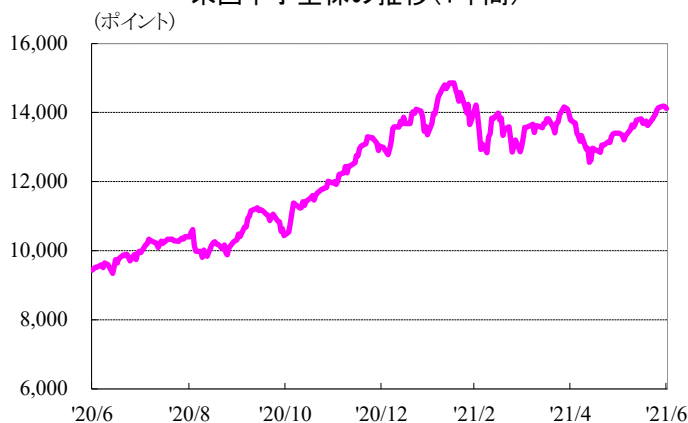
米国中小型株の推移(1年間)