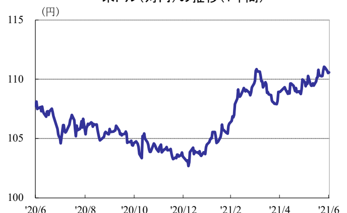
米ドル(対円)の推移(1年間)