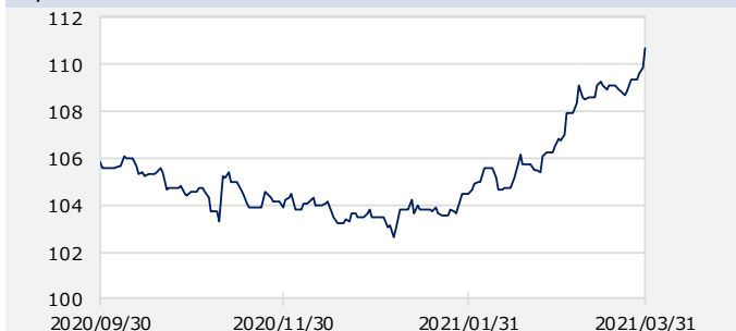
円/アメリカドル（円）