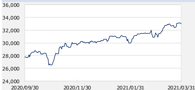
ダウ・ジョーンズ工業株価平均